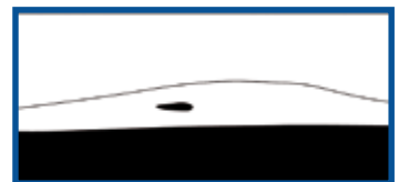
20 jaar: de Zandmotor is volledig opgegaan in een breder strand en nieuwe duinen.