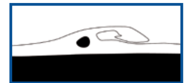
5 jaar later: de haakvorm verdwijnt

Golven, wind en zeestroming verplaatsen het zand. Het schiereiland verandert geleidelijk van vorm.