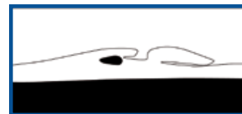
10 jaar later: het zand vindt zijn eigen weg.

Met de jaren zal het zand zich noord- en zuidwaarts verspreiden. De precieze vorm en de diepte van het duinmeer of de lagune zijn afhankelijk van het weer.